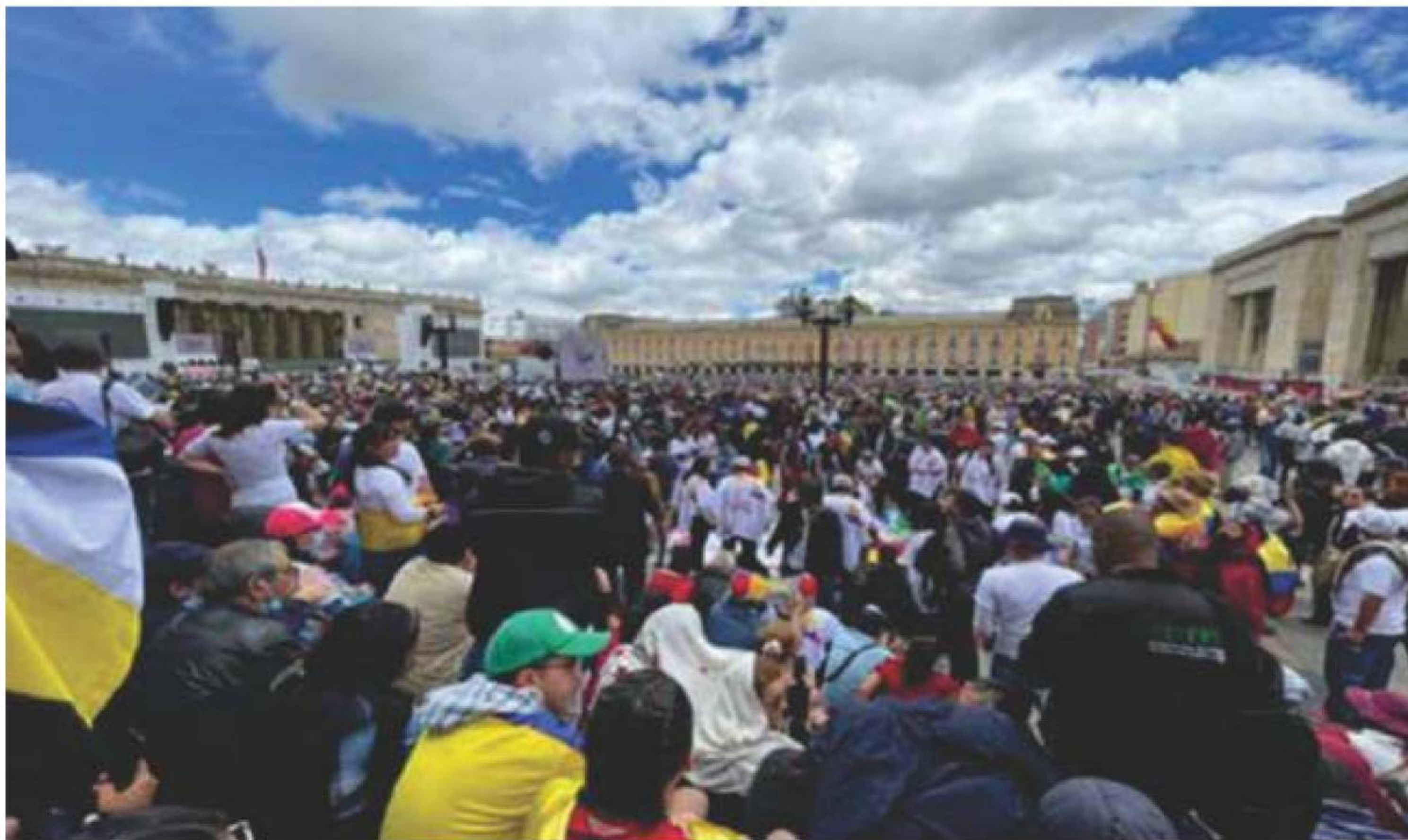
El pueblo en la plaza de Bolívar presenciando la histórica posesión de Gustavo Petro y Francia Márquez

E l triunfo electoral de Gustavo Petro y Francia Márquez el pasado 19 de junio se constituye en el hecho político más importante en la historia de la participación electoral de la izquierda, sectores alternativos y del campo democrático en la disputa por un nuevo poder, como anhelo popular que esperó por muchas décadas nuestro país. Al mismo tiempo, es el resultado de acumulados históricos en las luchas del movimiento social en resistencia por lograr transformaciones en el modelo económico, político y social a partir de la comprensión y práctica directa de avanzar en la construcción de la unidad como proceso de reagrupamiento al interior del Pacto Histórico. La impronta marcada y las luchas populares como acción cotidiana, se constituyen en referentes del CAMBIO POR LA VIDA con la formulación del programa de acción y lucha del Pacto Histórico a partir de las históricas gestas por el reconocimiento de los derechos, en batallas lideradas por el movimiento sindical, los sectores vinculados al trabajo cívico-comunitario, la juventud, el campesinado colombiano, las mujeres y el movimiento indígena, el movimiento estudiantil, los ambientalistas, defensores de los derechos humanos, las víctimas, los grupos étnicos y comunidades LGTBIQ+; al igual que múltiples expresiones del movimiento social que durante todo el siglo XX se movilizaban para exigir las transformaciones